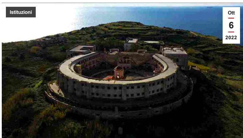
Veduta dell'ex carcere di Santo Stefano ripreso dal drone

ROMA – Si è svolta il 6 ottobre, presso la Sala Spadolini del Ministero della Cultura in via del Collegio Romano a Roma, la presentazione del percorso espositivo museale che sarà ospitato all'interno dell'ex carcere borbonico dell'isola di Santo Stefano e che verrà intitolato a David Sassoli.